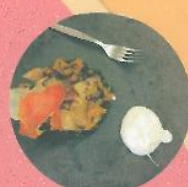
A de Maruja